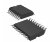
PIC16LC54CT-04I/SO Microchip Technology IC MCU 8BIT 768B OTP 18SOIC