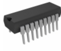
PIC16LC54C-04I/P Microchip Technology IC MCU 8BIT 768B OTP 18DIP