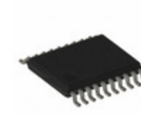
ATF16V8CZ-12XC Microchip Technology IC PLD 8MC 12NS 20TSSOP