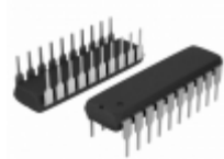
ATF16V8CZ-15PC Microchip Technology IC PLD 8MC 15NS 20DIP