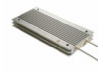
ARF400 75R J Ohmite RES CHAS MNT 75 OHM 5% 400W