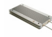
ARF300 6R J Ohmite RES CHAS MNT 6 OHM 5% 300W