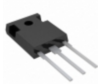
ARF445 Microsemi Corporation PWR MOSFET RF N-CH 900V TO-247AD