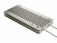
ARF400 10R J Ohmite RES CHAS MNT 10 OHM 5% 400W