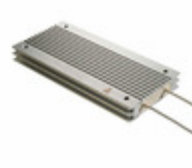
ARF400 8R J Ohmite RES CHAS MNT 8 OHM 5% 400W