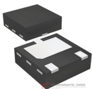
Image may be representation. See specs for product details.