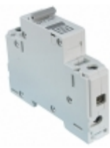
4420.0353 Schurter Inc. CIR BRKR THRM MAG 3A 180 VDC