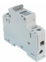
4420.0332 Schurter Inc. CIR BRKR THRM MAG 20A 180 VDC