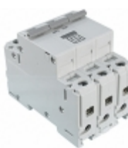
4420.0336 Schurter Inc. CIR BRKR THRM MAG 23A 480V 65V