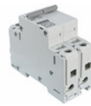
4420.0325 Schurter Inc. CIR BRKR THRM MAG 1A 480V 65V