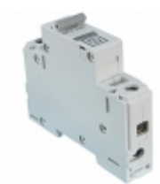
4420.0324 Schurter Inc. CIR BRKR THRM MAG 10A 180 VDC