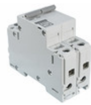
4420.0326 Schurter Inc. CIR BRKR THRM MAG 18A 480V 65V