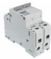
4420.0346 Schurter Inc. CIR BRKR THRM MAG 15A 480V 65V