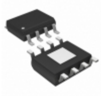
TLE4247EL30XUMA1 Infineon Technologies IC RELAY DRIVER CC 8DSO