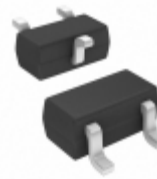
BC 847BT E6327 Infineon Technologies TRANS NPN 45V 0.1A SC-75