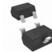
BC 846BW H6327 Infineon Technologies TRANS NPN 65V 0.1A SOT323