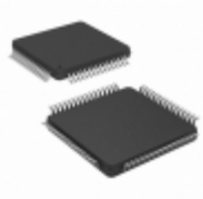
PIC24EP256MC206T-I/PT Microchip Technology IC MCU 16BIT 256KB FLASH 64TQFP