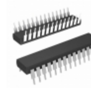
PIC24EP32GP202-E/SP Microchip Technology IC MCU 16BIT 32KB FLASH 28SDIP