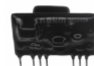
BP5842A Rohm Semiconductor IC LED DRIVER OFFLINE 1A 11SIP