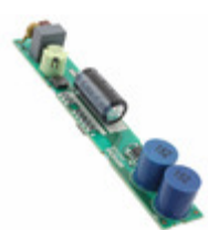
BP5890 LAPIS Semiconductor LED DRIVER CC AC/DC 10-28.8V