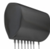
BP5801 Rohm Semiconductor IC MOTOR DRIVER PWM 9SIP