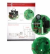
BP5843A APP BOARD LAPIS Semiconductor BOARD EVAL LED DRIVER BP5843A