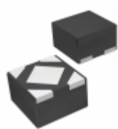
BU1CTD2WNVX-TL Rohm Semiconductor IC REG LDO 1.25V 0.2A 4SSON