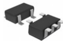
BU1JTD3WG-TR Rohm Semiconductor IC REG LDO 1.85V 0.2A 5SSOP