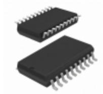
SY10EL38LZI-TR Microchip Technology IC CLK GEN /2 /4/6 5/3.3V 20SOIC