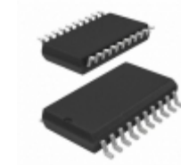
SY10EL38ZC Microchip Technology IC CLK GEN /2 /4/6 5/3.3V 20SOIC