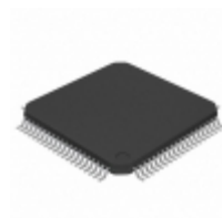
PIC18F8620T-E/PT Microchip Technology IC MCU 8BIT 64KB FLASH 80TQFP