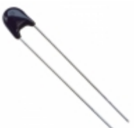
ERZ-VA5D560 Panasonic Electronic Components VARISTOR 56V 250A DISC 5MM