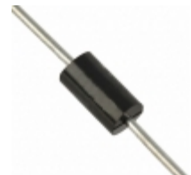
P6KE300CA Fairchild/ON Semiconductor TVS DIODE 256VWM 414VC DO15