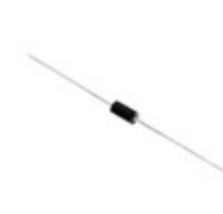
P6KE300CA-B Littelfuse Inc. TVS DIODE 256VWM 414VC AXIAL