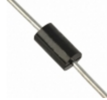
P6KE300CA AMI Semiconductor / ON Semiconductor TVS DIODE 256V 414V DO15