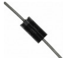
P6KE300C-G Comchip Technology TVS DIODE 243VWM 430VC DO15