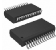
PIC18F26K42T-I/SS Micrel / Microchip Technology 64KB FLASH, 4KB RAM, 1KB EEPROM