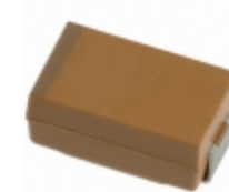
TAJD107K006SNJ AVX Corporation CAP TANT 100UF 6.3V 10% 2917