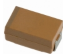
TAJD107K006RNJ AVX Corporation CAP TANT 100UF 6.3V 10% 2917