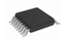
PL602-380C Microchip Technology IC CLK BUFFER