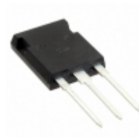
APT25GN120BG Microsemi Corporation IGBT 1200V 67A 272W TO247