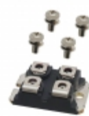
APT25GF120JCU2 Microsemi Corporation MOD IGBT NPT SIC CHOPPER SOT227