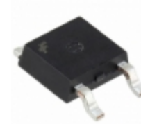
KSH42CTF Fairchild/ON Semiconductor TRANS PNP 100V 6A DPAK