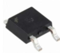
KSH41CTF Fairchild/ON Semiconductor TRANS NPN 100V 6A DPAK