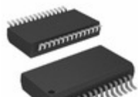
PIC16F76T-I/SS Microchip Technology IC MCU 8BIT 14KB FLASH 28SSOP