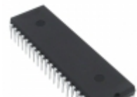
PIC16F77-E/P Microchip Technology IC MCU 8BIT 14KB FLASH 40DIP