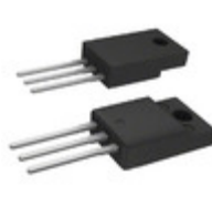
T1635T-8FP STMicroelectronics TRIAC ALTERNISTOR 800V TO220FPAB