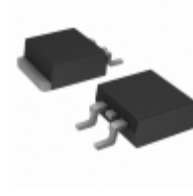
T1635H-6G STMicroelectronics TRIAC ALTERNISTOR 600V 16A D2PAK