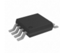
ADG1401BRMZ Analog Devices Inc. IC SWITCH SPST 10HM RON 8MSOP