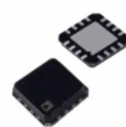
ADG1404YCPZ-REEL Analog Devices Inc. IC MULTIPLEXER 4X1 16LFCSP