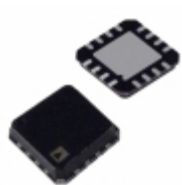
ADG1404YCPZ-REEL7 Analog Devices Inc. IC MULTIPLEXER 4X1 16LFCSP