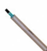
SP-L-1000-203-3%-RH Spectra Symbol SENSOR SOFTPOT 20K OHM 1000MM