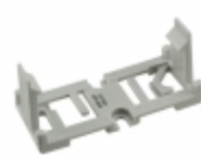
SP-MA Panasonic ACCY MOUNTING PLATE FOR SP RELAY