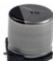
EEV-TG1K470UP Panasonic Electronic Components CAP ALUM 47UF 20% 80V SMD