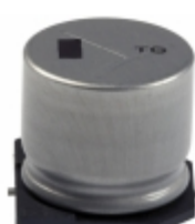
EEV-TG1K471M Panasonic Electronic Components CAP ALUM 470UF 20% 80V SMD