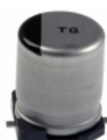
EEV-TG1K220UP Panasonic Electronic Components CAP ALUM 22UF 20% 80V SMD