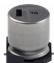
EEV-TG1K470Q Panasonic Electronic Components CAP ALUM 47UF 20% 80V SMD