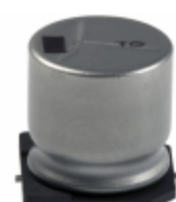
EEV-TG1K221UM Panasonic Electronic Components CAP ALUM 220UF 20% 80V SMD