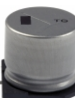
EEV-TG1K331M Panasonic Electronic Components CAP ALUM 330UF 20% 80V SMD