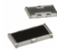
PS3216GT2-R50-T1 Susumu CHIP POWER SPLITTER 1206 SIZE, 0