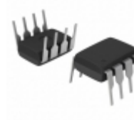
PS323CPA Diodes Incorporated IC SWITCH DUAL SPST 8DIP