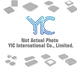
PS321B1 PARADE PS321B1 PARADE