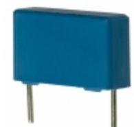
B81141C1103M000 EPCOS CAP FILM 10000PF 20% 440VAC RAD