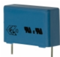
B81130C1474M EPCOS (TDK) CAP FILM 0.47UF 20% 275VAC RAD