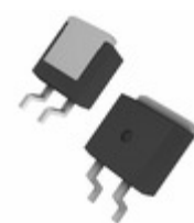
DSEC29-02AS-TUBE IXYS DIODE ARRAY GP 200V 15A TO263