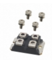
DSEC240-06A IXYS DIODE MODULE 600V 120A SOT227B