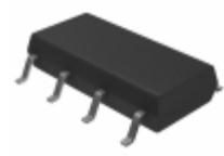
AQW210SZ Panasonic RELAY OPTO DPST 100MA 8 SOP 350V