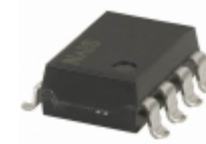
AQW210TSX Panasonic RELAY OPTO SPST 120MA 8 SOP