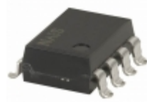
AQW210TS Panasonic RELAY OPTO SPST 120MA 8 SOP