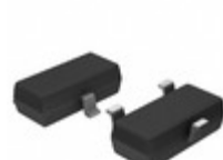
MCP130T-485I/TT Microchip Technology IC SUPERVISOR 4.85V LOW SOT23