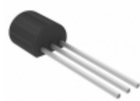
MCP131-315E/TO Microchip Technology IC SUPERVISOR 3.08V LOW TO-92