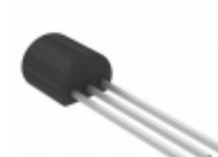
MCP131-195I/TO Microchip Technology IC SUPERVISOR 1.95V LOW TO-92