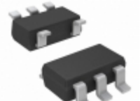
MCP1316MT-20LI/OT Microchip Technology IC SUPERVISOR 2V SOT23-5