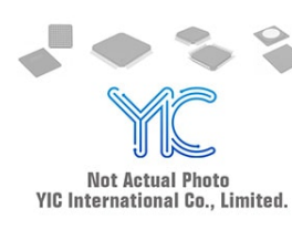
MB85RC1MTPNF-G-JNE Fujitsu MB85RC1MTPNF-G-JNE Fujitsu