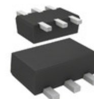
DMC5640L0R Panasonic Electronic Components TRANS PREBIAS DUAL NPN SMINI6