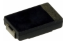
EEF-LL0J470R Panasonic Electronic Components CAP ALUM POLY 47UF 20% 6.3V SMD