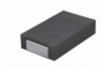
EEF-LR0E181R4 Panasonic Electronic Components CAP ALUM POLY 180UF 20% 2.5V SMD