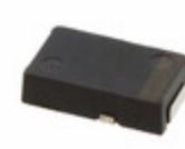
EEF-HX1E220R Panasonic Electronic Components CAP ALUM POLY 22UF 20% 25V SMD