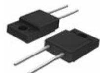
BYWF29-200HE3/45 Electro-Films (EFI) / Vishay DIODE GEN PURP 200V 8A ITO220AC