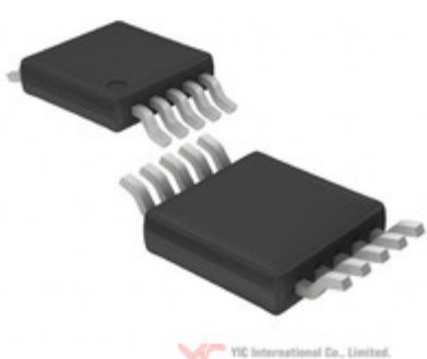
Image may be representation. See specs for product details.