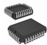
AT28LV256-25JI Microchip Technology IC EEPROM 256KBIT 250NS 32PLCC