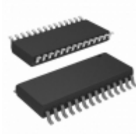
AT28LV256-25SI Microchip Technology IC EEPROM 256KBIT 250NS 28SOIC