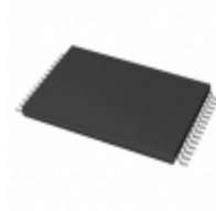
AT28LV256-20TC Microchip Technology IC EEPROM 256KBIT 200NS 28TSOP