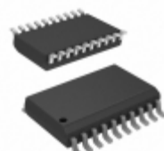
PIC18F13K22-I/SO Microchip Technology IC MCU 8BIT 8KB FLASH 20SOIC