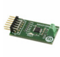
MAX31856PMB1# Maxim Integrated DEMO KIT FOR MAX31856