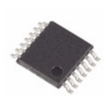
MAX31856MUD+ Maxim Integrated IC CONV THERMOCOUPLE 14TSSOP