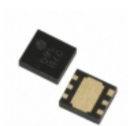
XC6121C517ER-G Torex Semiconductor Ltd IC WATCHDOG TIMER 6-USP