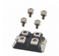
DMA150E1600NA IXYS DIODE GP 1.6KV 150A SOT227B