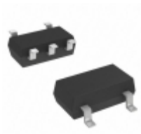
DMA202010R Panasonic Electronic Components TRANS 2PNP 50V 0.1A MINI5