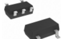
DMA201010R Panasonic Electronic Components TRANS 2PNP 50V 0.1A MINI5