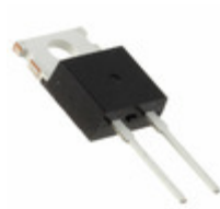
DMA10I1600PA IXYS DIODE GEN PURP 1600V 10A TO220AC