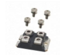
DMA150YC1600NA IXYS RECT BRIDGE GP 1600V SOT227B