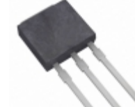
QK006VH4TP Littelfuse Inc. TRIAC ALTERNISTOR 1KV 6A TO251