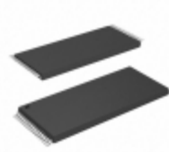
AT49BV001T-90TI Microchip Technology IC FLASH 1MBIT 90NS 32TSOP