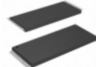
AT49BV001T-12TI Microchip Technology IC FLASH 1MBIT 120NS 32TSOP