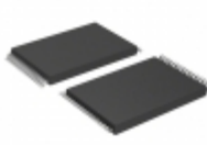
AT49BV001T-90VI Microchip Technology IC FLASH 1MBIT 90NS 32VSOP