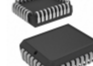
AT49BV001T-90JI Microchip Technology IC FLASH 1MBIT 90NS 32PLCC