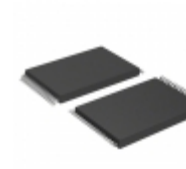
AT49BV001T-90VC Microchip Technology IC FLASH 1MBIT 90NS 32VSOP