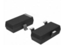
MIC809SUY-TR Microchip Technology IC RESET GEN 2.93V VTH SOT23-3