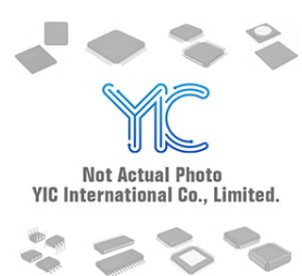
MIC809SUJR MICREL MIC809SUJR MICREL