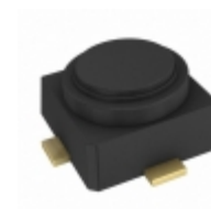
CE3512K2-C1 CEL RF FET 4V 12GHZ 4MICROX