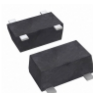
CE3521M4-C2 CEL RF FET 4V 20GHZ SOT343