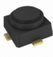
CE3512K2 CEL RF FET 4V 12GHZ 4MICROX