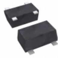
CE3514M4-C2 CEL RF MOSFET PHEMT FET 2V SOT343