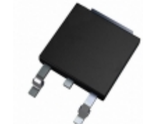
DGS17-030CS IXYS DIODE SCHOTTKY 300V 29A TO252AA