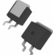
DGS10-025AS IXYS DIODE SCHOTTKY 250V 12A TO263AB