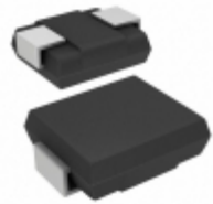
ERZ-VF2M201 Panasonic Electronic Components VARISTOR 200V 600A 2SMD JLEAD