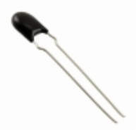
ERZ-VA7V680 Panasonic Electronic Components VARISTOR 68V 500A DISC 7MM