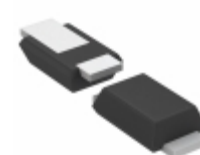
TFZVTR5.6B Rohm Semiconductor DIODE ZENER 5.6V 500MW TUMD2M