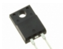
SDURF560 SMC Diode Solutions DIODE GEN PURP 600V ITO220AC