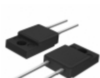
SDURF520 SMC Diode Solutions DIODE GEN PURP 200V ITO220AC