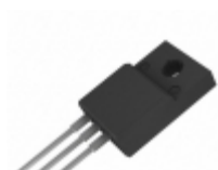
SDURF3060CTR SMC Diode Solutions DIODE ARRAY GP 600V ITO220AB