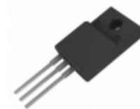
SDURF3040CTR SMC Diode Solutions DIODE GEN PURP 400V 15A ITO220AB