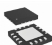
SY88992LMG-TR Microchip Technology IC VCSEL DRIVER SGL 3.3V 16MLF