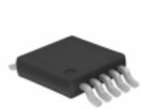
SY88983VKI-TR Microchip Technology IC AMP POST 5/3.3V TTL SD 10MSOP