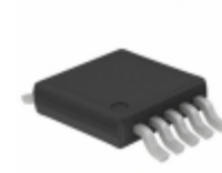
SY88983VKG Microchip Technology IC POST AMP CML LIMITING 10- MSOP