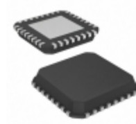
ISL6531CRZ Intersil IC CONTROLLER INTEL 32QFN