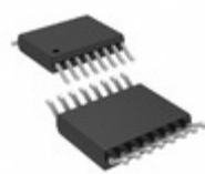
LTC2367CMS-18#TRPBF ADI (Analog Devices, Inc.) IC ADC 18BIT 500K 1CH 16MSOP